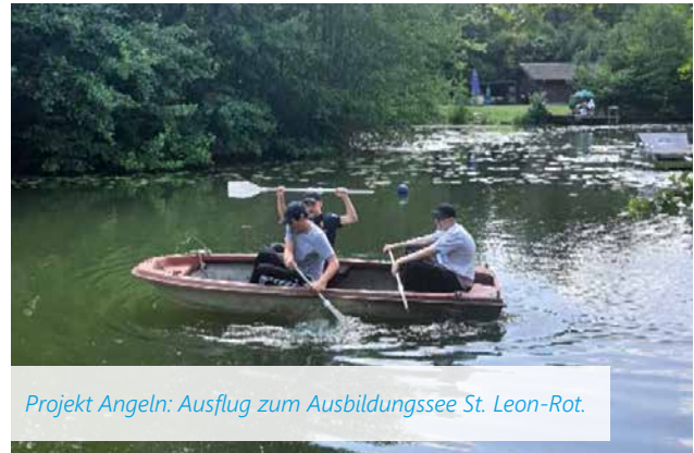
Projekt Angeln: Ausflug zum Ausbildungssee St. Leon-Rot.

Im Rahmen der Projektwoche konnten sich die Schüler/-innen der M.A.I. Mannheim vier Tage lang in einem selbst gewählten Projekt engagieren. Hierbei standen viele interessante Projekte aus den unterschiedlichsten Bereichen zur Auswahl.