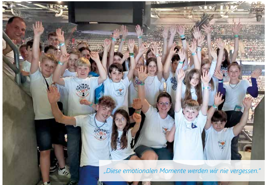
„Diese emotionalen Momente werden wir nie vergessen.“

Am 19. Juni 2024 wurde die SAP-Arena in Mannheim Schauplatz eines einzigartigen Konzerts: Der M.A.I.-Schulchor, bestehend aus 27 Kindern der Klassenstufen 5 bis 8 der Comenius Ganztagsrealschule und des Beruflichen Merkur Gymnasiums, trat gemeinsam mit 6.000 weiteren Kindern auf. Unter Leitung von Professor Fabian Sennholz sangen sie zwölf sorgfältig einstudierte Songs.