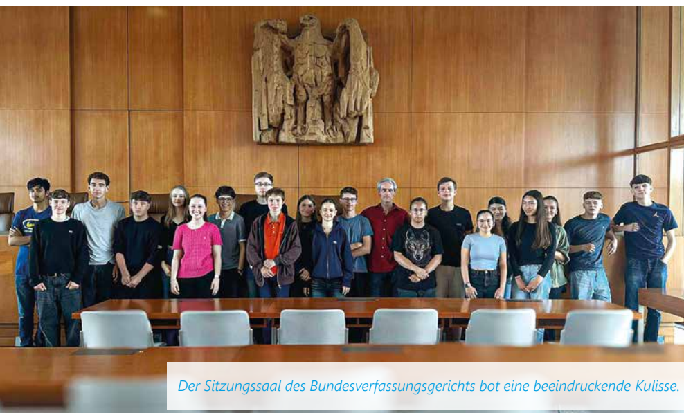
Der Sitzungssaal des Bundesverfassungsgerichts bot eine beeindruckende Kulisse.

Am 21. Juni 2024 besuchte die Klasse BG 10 mit ihrem Lehrer Klaus-Konstantin Sondermann im Rahmen des Geschichts- und Gemeinschaftskundeunterrichts das Bundesverfassungsgericht am Karlsruher Schloss.