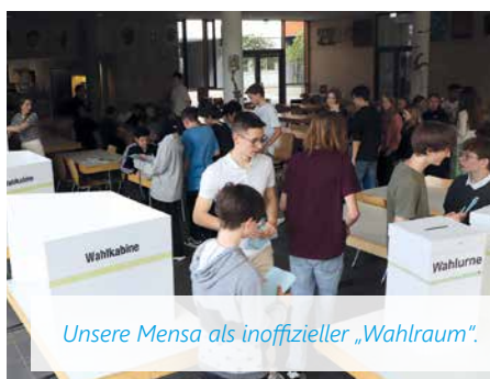
Unsere Mensa als inoffizieller „Wahlraum“.

meinsame Verteidigungspolitik anstreben könnte. Europa muss zusammenhalten, um gegenüber den USA, Russland und China politisch, wirtschaftlich sowie militärisch zu bestehen. Unterschiedliche Sichtweisen gab es wegen der Geschwindigkeit einer zunehmenden Europäischen Zentralisierung, um die Bürger/-innen mitzunehmen und nicht abzuschrecken. Am Ende betonten alle die Wichtigkeit, wählen zu gehen. Die Politiker/-innen bedankten sich für die Einladung und lobten das politische Interesse und Engagement der Schüler/-innen der Comenius Ganztagsrealschule und des Beruflichen Merkur Gymnasiums.