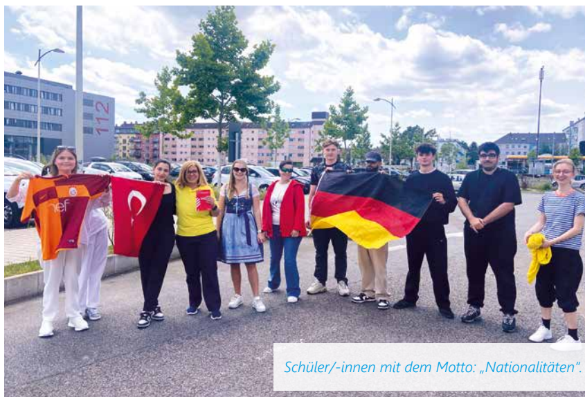
Schüler/-innen mit dem Motto: „Nationalitäten“.

Mitte Juni verwandelte sich die M.A.I. Mannheim in eine bunte Bühne der Kreativität und des Spaßes: Die diesjährige Mottowochende der Abiturient/-innen stand auf dem Programm. Das Ziel war klar definiert: Nach den anstrengenden schriftlichen Abiturprüfungen sollte gute Laune verbreitet und der Schulalltag mit fröhlichen Kostümen und Themen belebt werden.