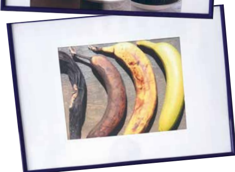
Beeindruckende Darstellungen der Zeit.