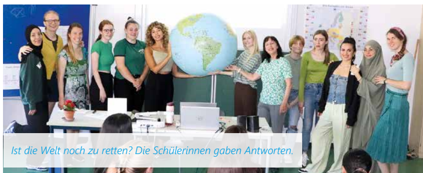
Ist die Welt noch zu retten? Die Schülerinnen gaben Antworten.

Bei der Abschlusspräsentation der 2-jährigen schulischen Berufsausbildung zum „International Management Assistant“