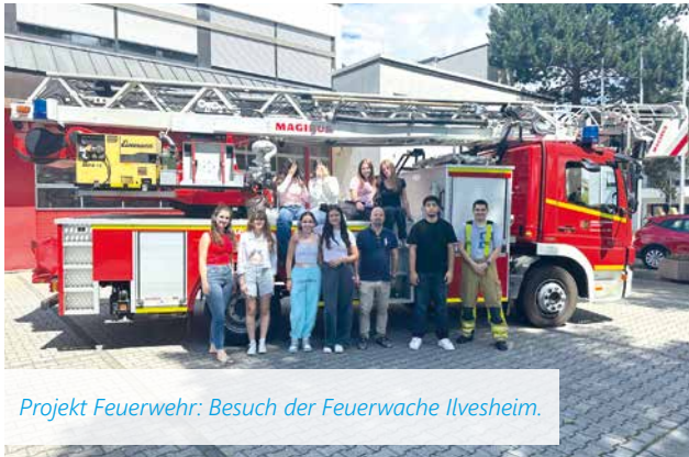
Projekt Feuerwehr: Besuch der Feuerwache Ilvesheim.