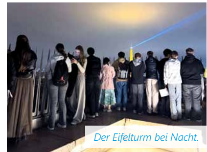
Der Eiffelturm bei Nacht.

Gelegenheit, ihre Sprachkenntnisse anzuwenden. Das Programm war vielfältig: Neben einer entspannten Bootsfahrt auf der Seine und der Besichtigung der wieder aufgebauten Kathedrale Notre-Dame stand ein bewegender Besuch im berühmten Cimetière du Père Lachaise auf dem Plan. Ein besonderes kulturelles Erlebnis bot zudem die immersive Ausstellung im Atelier des Lumières.