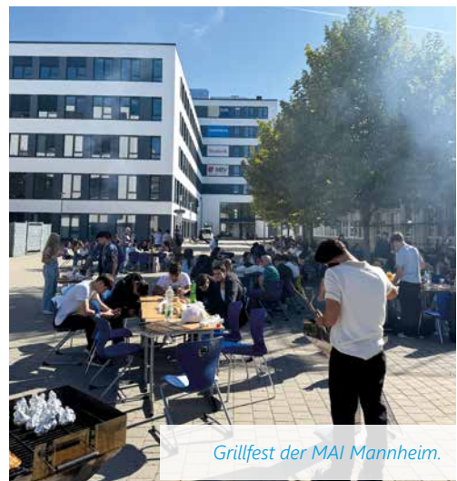
Grillfest der MAI Mannheim.

Besonders schön ist, dass auch ehemalige Absolvent/-innen die Gelegenheit nutzten, noch einmal Teil der Schulgemeinschaft zu sein und gemeinsam mit allen zu feiern. So wurde an diesem Tag gegrillt, gegessen und viel gelacht – ein gelungener Start in das neue Schuljahr und ein schönes Zeichen für das starke Miteinander an der M.A.I. Mannheim.